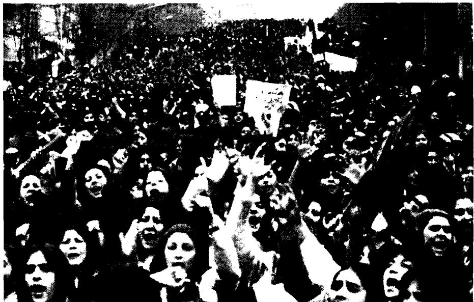
Manifestation des femmes contre le voile à Téhéran en 1979.

Occidentaliser l'émancipation des femmes revient à gommer qu'elle est une conquête, à faire fi des combats menés depuis plusieurs siècles pour sa réalisation, à oublier le long, je pourrais même dire l'interminable, processus dont elle est la conséquence.