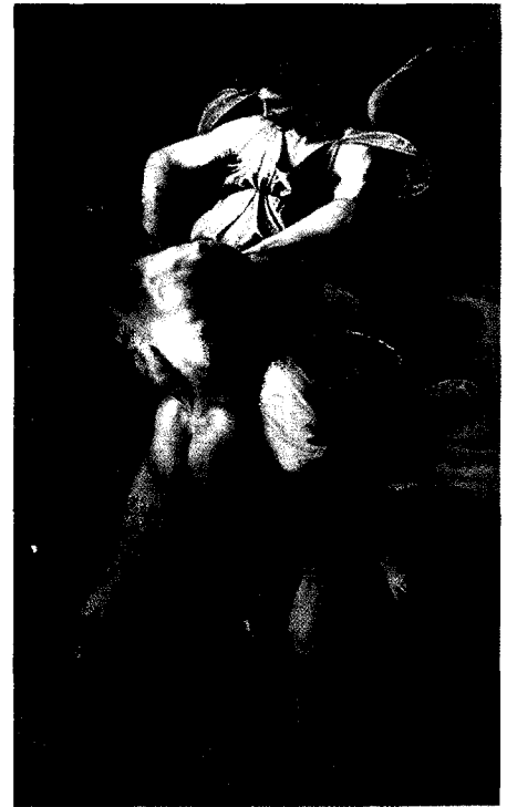
La lutte de Jacob avec l'ange, huile sur toile de Paul Baudry (1853). Musée de La Roche-sur-Yon. Évocation de l'éternel combat entre le bien et le mal, ici représenté sous les traits d'une femme.

Il convient de rappeler que cette autre manière d'occidentaliser le féminisme est une très vieille histoire, rabâchée depuis longtemps. Je l'ai entendu par exemple à Paris, en 1977, lorsque la coordination des femmes noires décida de lutter contre l'excision et l'infibulation et que leurs camarades révolutionnaires leur rétorquaient que s'en prendre aux traditions n'était ni un combat prioritaire ni un combat anti-impérialiste. Ou encore en 1979, à Téhéran, lorsque par milliers des femmes se rassemblaient dans les rues de la capitale iranienne contre le port du tchador prôné par l'ayatollah Khomeiny tout juste rentré de son exil en France.