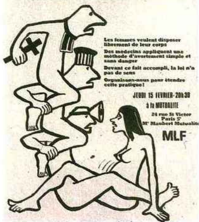
APPEL Affiche de 1973. Le droit à l'avortement est l'une des premières victoires du MLF. La loi autorisant l'IVG est promulguée en janvier 1975.