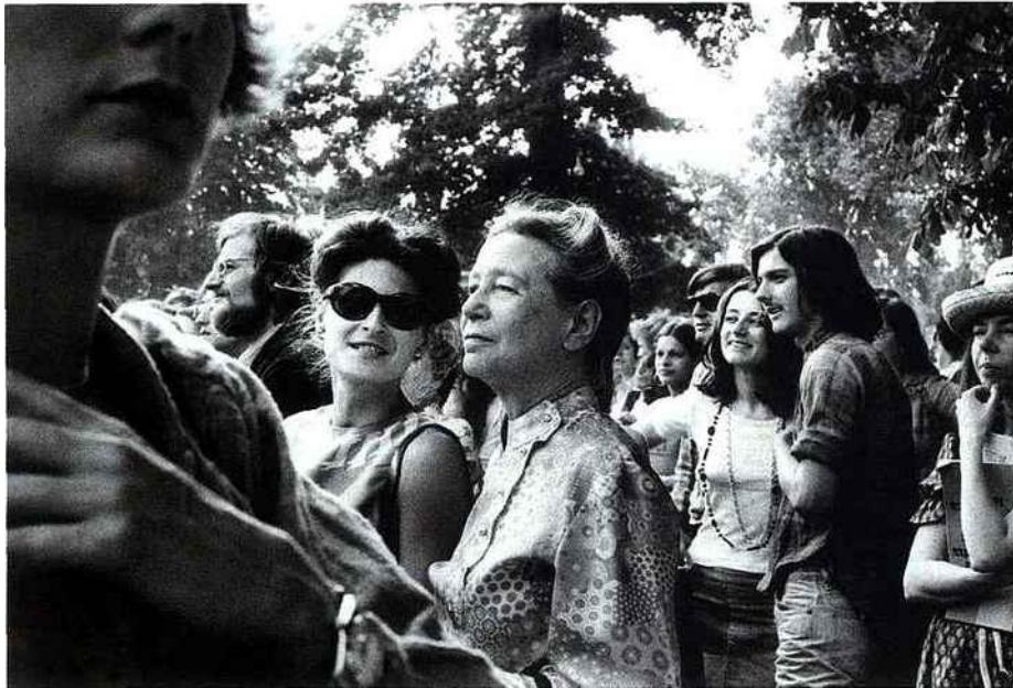
PIONNIÈRE En 1973, Simone de Beauvoir participe à un rassemblement du MLF à Vincennes. L'auteur du Deuxième Sexe (1949) est une figure de proue du mouvement féministe.

création d'un secrétariat à la condition féminine en 1974, ou lorsque l'ONU proclame 1975 : Année de la femme .