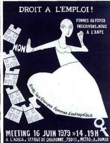
RELAIS Créée en 1974, la Coordination des groupes femmes d'entreprise poursuit le combat féministe sur le front du travail

Antoinette Fouque, qu'on associe si facilement aux combats féministes, rejette en bloc