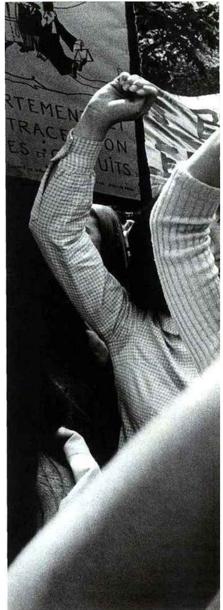
EN LUTTE 20 novembre 1971, manifestation de rue d