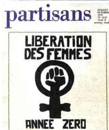
MANIFESTE Juillet 1970, numéro spécial de Partisans , la revue de François Maspero.

A la Sorbonne, Antoinette Fouque est, elle aussi, témoin d'une « révolution viriliste ». Nous n'avons pas pu la questionner : psychanalyste, créatrice des éditions Des Femmes, universitaire, politologue, elle oppose aux journalistes son emploi du temps chargé. Mais elle écrit dans Génération MLF (éd. Des femmes, 2008) : « L'acteur principal [de