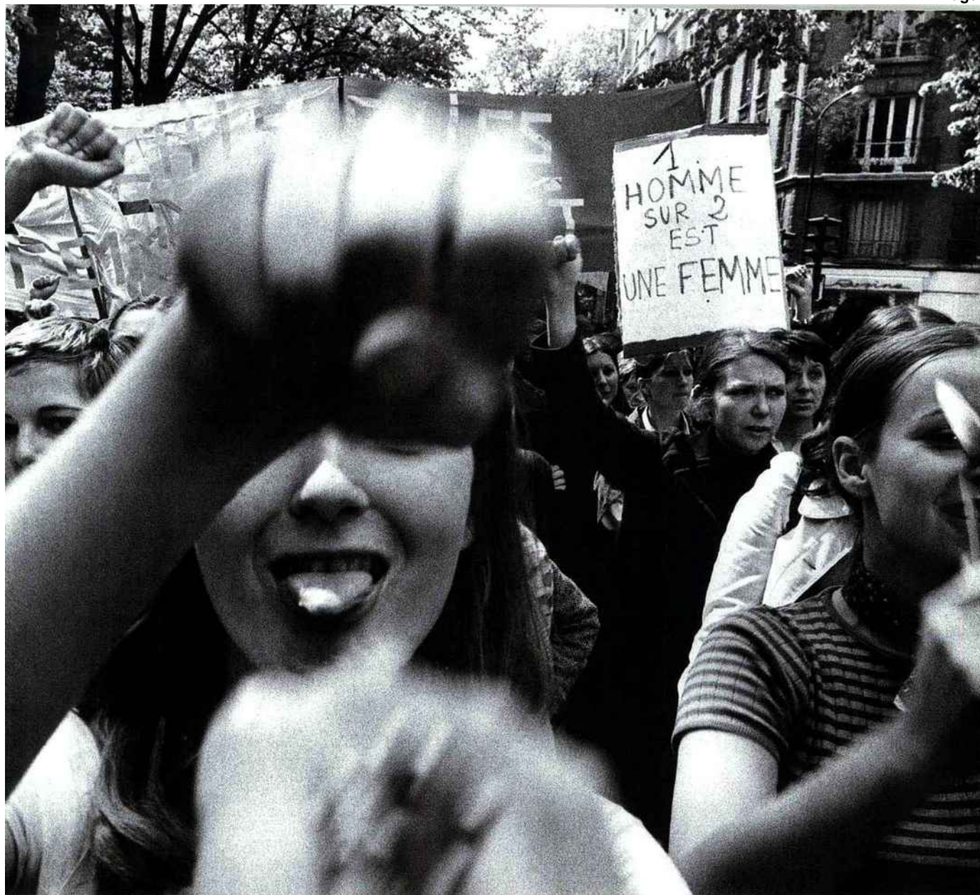
MLF, à Paris 3 000 femmes défilent pour l'avortement et la contraception libres et gratuits.