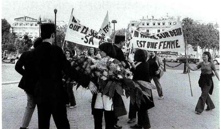
DÉBUTS 26 août 1970, devant l'Arc de triomphe la première apparition publique du MLF